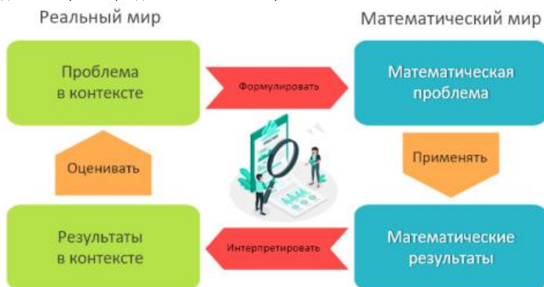
Рис. 1. Диагностическая модель математической грамотности

его друзей и сверстников. Проблемы, которые предлагаются в профессиональных контекстах, связаны со школьной жизнью или трудовой деятельностью. Общественные контексты связаны с жизнью общества (местного, национального или всего мира). Ситуации, связанные с жизнью местного общества, касаются проблем, возникающих в ближайшем окружении учащихся. Контексты, отнесенные к научным, обычно связаны с применением математики к науке или технологии, явлениям физического мира. Математическое содержание, которое используется при конструировании заданий, сконцентрировано вокруг четырех фундаментальных идей. Изменение и зависимости – задания, связанные с математическим описанием зависимости между переменными в различных процессах, относятся к алгебраическому материалу. Пространство и форма – задания, относящиеся к пространственным и плоским геометрическим формам и отношениям, т.е. к геометрическому материалу. Количество – задания, связанные с числами и отношениями между ними, в программах по математике этот материал чаще всего относится к курсу арифметики. Неопределенность и данные – эта область охватывает вероятностные и статистические явления и зависимости, которые являются предметом изучения разделов статистики и вероятности.